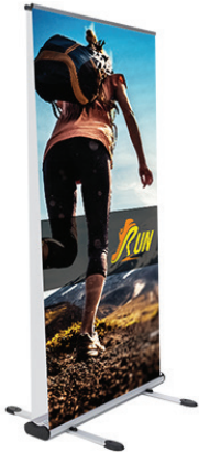
STRUCTURE ET BANNIÈRE